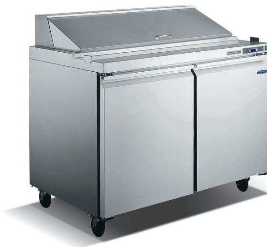
Table d'apprêtage des salades à deux portillons en acier inoxydable CST119-60